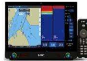
13인치, 어군탐지기능 연동(GN-E1300F)