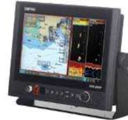
13인치, 어군탐지기능 연동(SEN-1300F)